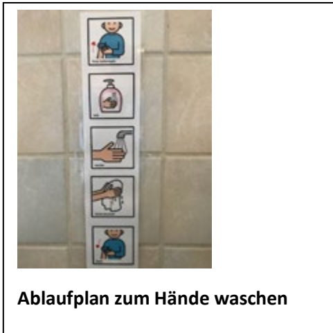
Ablaufplan zum Hände waschen